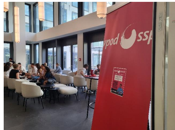
Unser Stand am "Kaffee & Gipfeli"-Anlass an der PHZH

Der Kindergarten bleibt ein zentrales bildungspolitisches Thema, insbesondere im Hinblick auf seine vollständige Anerkennung als Teil der obligatorischen Schule. Deshalb sind wir regelmässig mit der Fachgruppe Kindergarten der Stadt Zürich in Kontakt. Wir setzen uns weiterhin dafür ein, dass die Arbeitsbedingungen der Kindergartenlehrpersonen verbessert werden.