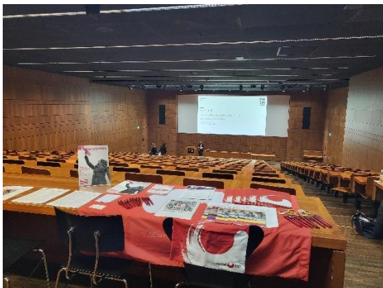
Der VPOD stellt sich an der PHZH vor

Neben den regelmässigen Treffen und der politischen Arbeit haben wir im vergangenen Jahr verstärkt den direkten Austausch mit Schulen und Berufsverbänden gesucht.