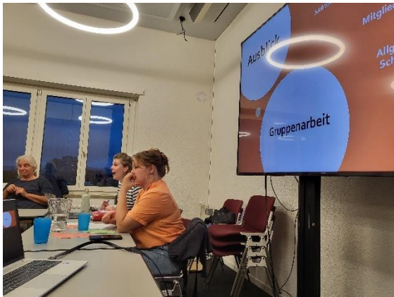
Eindruck aus einem Treffen der Volksschulgruppe

Der Volksschultreff hat sich seit April 2024 etabliert und fand bereits viermal statt.