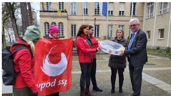
Petitionsübergabe an der Kantonsratspräsidium

Zusammen mit der Sektion Zürich Kanton führten wir die Kampagne «Teuerungszulage in Gefahr!» durch. Der Kantonsrat wollte nämlich im konsolidierten Entwicklungs- und Finanzplan (KEF) festschreiben, dass kantonalen Angestellten — also auch ganz vielen Lehrer:innen — 2026 und 2027 die Teuerung nur zur Hälfte ausgeglichen werden soll. Dagegen wehrten wir uns zusammen mit den VPV, der SP und den Jungen Grünen und knapp 2500 Unterzeichnenden. Leider überwies der Kantonsrat das Geschäft trotz des starken Widerstands. Es ist jetzt zu hoffen, dass der Regierungsrat bei dieser Reallohnkürzung nicht Hand bietet.